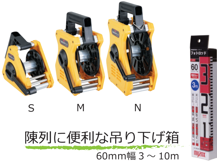
陳列に便利な吊り下げ箱 60mm幅 3～10m

引き出す際にボディにテープが触れることなく 50mロッドでもスムーズに軽く引き出し・巻取れます。