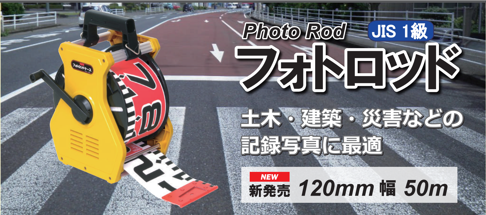
Photo Rod JIS 1級 フォトロッド